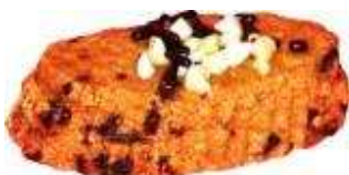
Kod : 13 Almond Cappucinno Bahan: Cappucinno, chocolate, badam