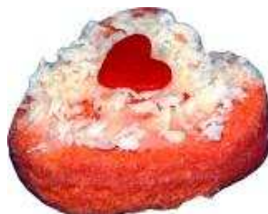
Kod : 10 Lovely Strawberry Bahan: Susu, badam