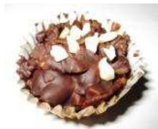
Kod: 6 Cornflake Ferrero Rocher Cornflake, kacang, chocolate, badam