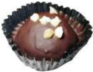
Kod : 1 London Almond Bahan: Badam, chocolate, susu, butter