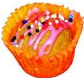
Kod: 5 Green Love Tuscany Bahan: Kelapa kering, kacang