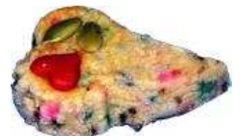
Kod : 12 True Love Bahan: Tepung hoen- kwe, chocolate