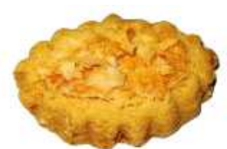
Kod: 8 Biskut Nestum Bahan: Nestum, badam