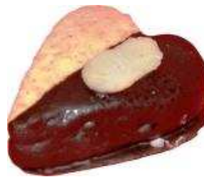
Kod: 7 Chocolate Sesame Nestum Bahan: Nestum, badam, chocolate