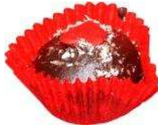
Kod: 2 Mocca Nestum Bahan: Nestum, badam, chocolate