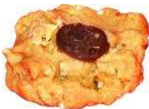
Kod: 9 London Cookies Bahan: Badam, susu, hersyey syrup