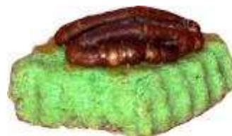
Kod: 11 Pecan Pandan Bahan: Kacang pecan, santan, kentang