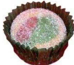
Kod : 3 Crystal Ball Bahan: Kacang, minyak sapi