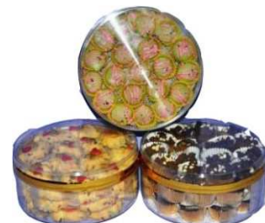
Biskut akan dipacking dalam bekas di atas. Kandungan diantara 50 - 60 butir biskuT