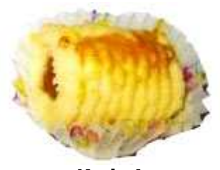
Kod: 4 Tart Gulung Nenas Bahan: Nenas, minyak sapi, butter