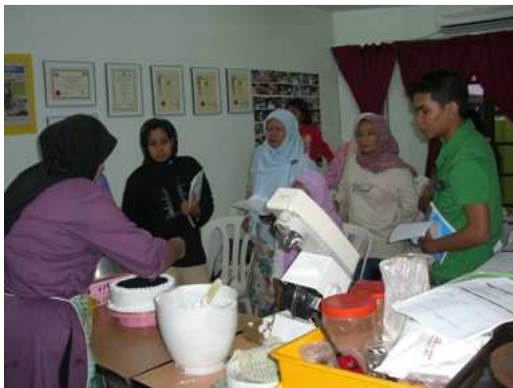
Kelas Kek Modern (Black Forest, Blueberry Cake dll) yang telah diadakan pada 5 Jan 2008