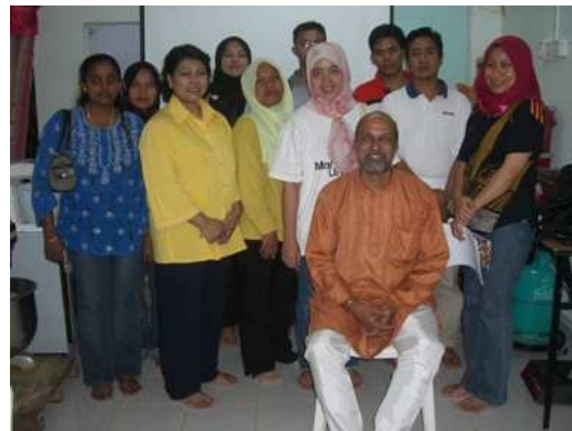
Kelas Pengendalian Makanan yang telah diadakan pada 27 Jan 2008 dan Sijil di Iktiraf oleh Kem. Kesihatan Malaysia