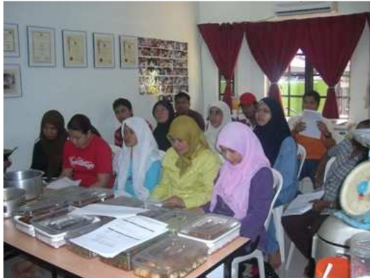
Kelas Nasi Lemak kukus yang telah diadakan pada 19 Jan. 2008