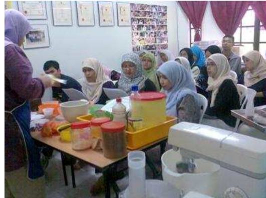
Kelas Aneka Kek Buah yang telah diadakan pada 26 Jan 2008